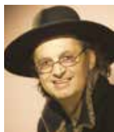
MARC VEYRAT LA MAISON DES BOIS France