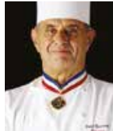
PAUL BOCUSE Rest. PAUL BOCUSE France