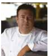
PETER GILMORE QUAY Australie