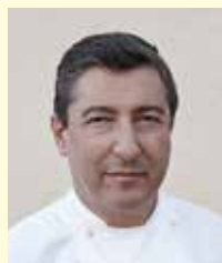
JOAN ROCA EL CELLER DE CAN ROCA Espagne