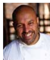
SAT BAINS Rest. SAT BAINS Royaume Uni