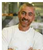
ALEX ATALA D.O.M. Bésil