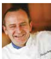
JEAN-GEORGES KLEIN VILLA RENE LALIQUE France