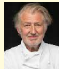
PIERRE GAGNAIRE Rest. PIERRE GAGNAIRE France