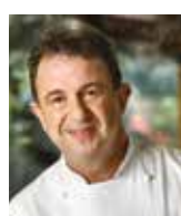
MARTIN BERASATEGUI Rest. MARTIN BERASATEGUI - Espagne