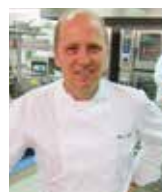
HEINZ BECK LA PERGOLA Italie