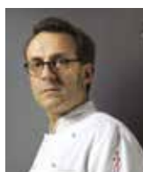
MASSIMO BOTTURA OSTERIA FRANCESCANA Italie