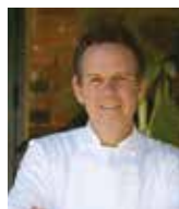
THOMAS KELLER THE FRENCH LAUNDRY USA