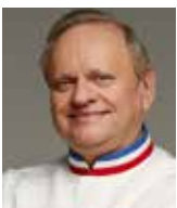
JOEL ROBUCHON L'ATELIER DE JOEL ROBUCHON - France