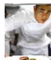
ANDRE CHIANG Rest. ANDRE Singapour