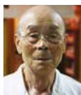
JIRO ONO JIRO HONTEN Japon