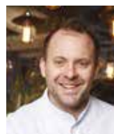
DAVID TOUTAIN Rest. DAVID TOUTAIN France