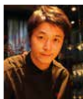
HIROYASU KAWATE FLORILEGE Japon