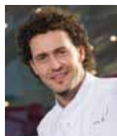
STEFANO BAIOTTO VILLA FELTRINELLI Italie