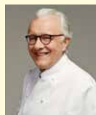
ALAIN DUCASSE PLAZA ATHENEES France