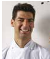
MASSIMILIANO ALAJMO LE CALANDRE Italie