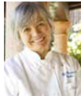
NADIA SANTINI DAL PESCATORE Italie