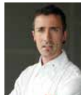
ENEKO ATXA AZURMENDI Espagne