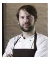
RENE REDZEPI NOMA Danemark