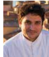
MAURO COLAGRECO MIRAZUR France