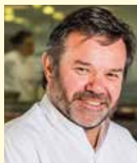
MICHEL TROISGROS Maison TROISGROS France