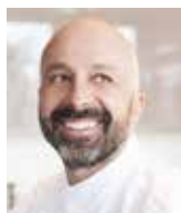
NIKO ROMITO REALE Italie