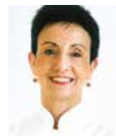
CARME RUSCALLEDA SANT PAU Espagne