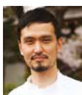
SHINOBU NAMEE L'EFFERVESCENCE Japon