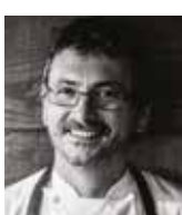
ANDONI LUIS ADURIZ MUGARITZ Espagne