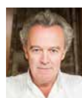
ALAIN PASSARD L'ARPEGE France