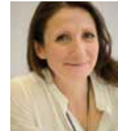
ANNE-SOPHIE PIC MAISON PIC France