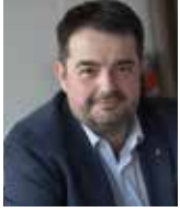
JEAN-FRANCOIS PIEGE LE GRAND RESTAURANT France