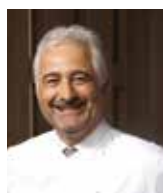
GUY SAVOY Rest. GUY SAVOY France