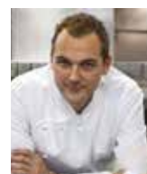
DANIEL HUMM ELEVEN MADISON PARK USA