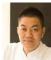
YOSHIHIRO NARISAWA Rest. NARISAWA Japon