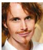
GRANT ACHATZ ALINEA USA