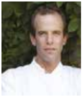
DAN BARBER BLUE HILL FARM USA