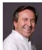
DANIEL BOULUD Rest. DANIEL USA