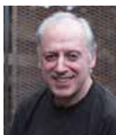
VICTOR ARGUINONIZ ASADOR ETXEBARRI Espagne