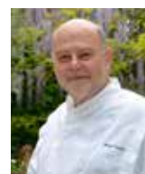
MICHEL TRAMA Rest. MICHEL TRAMA France