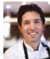
BEN SHEWRY ATTICA Australie